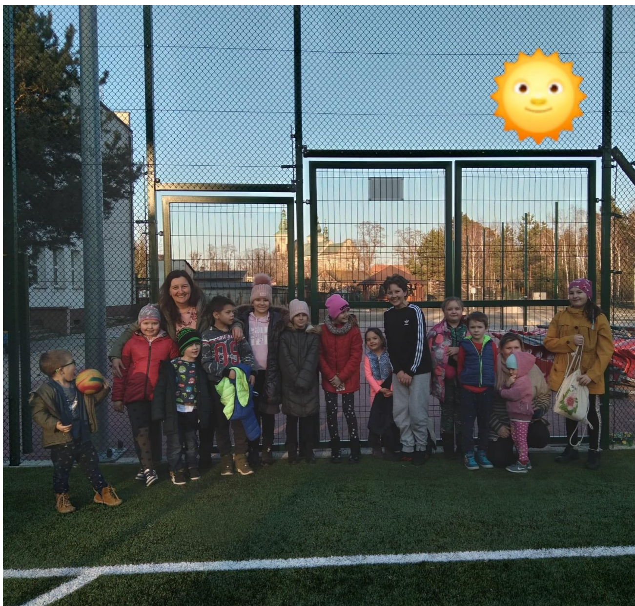
zajęcia sportowe na boisku do piłki nożnej