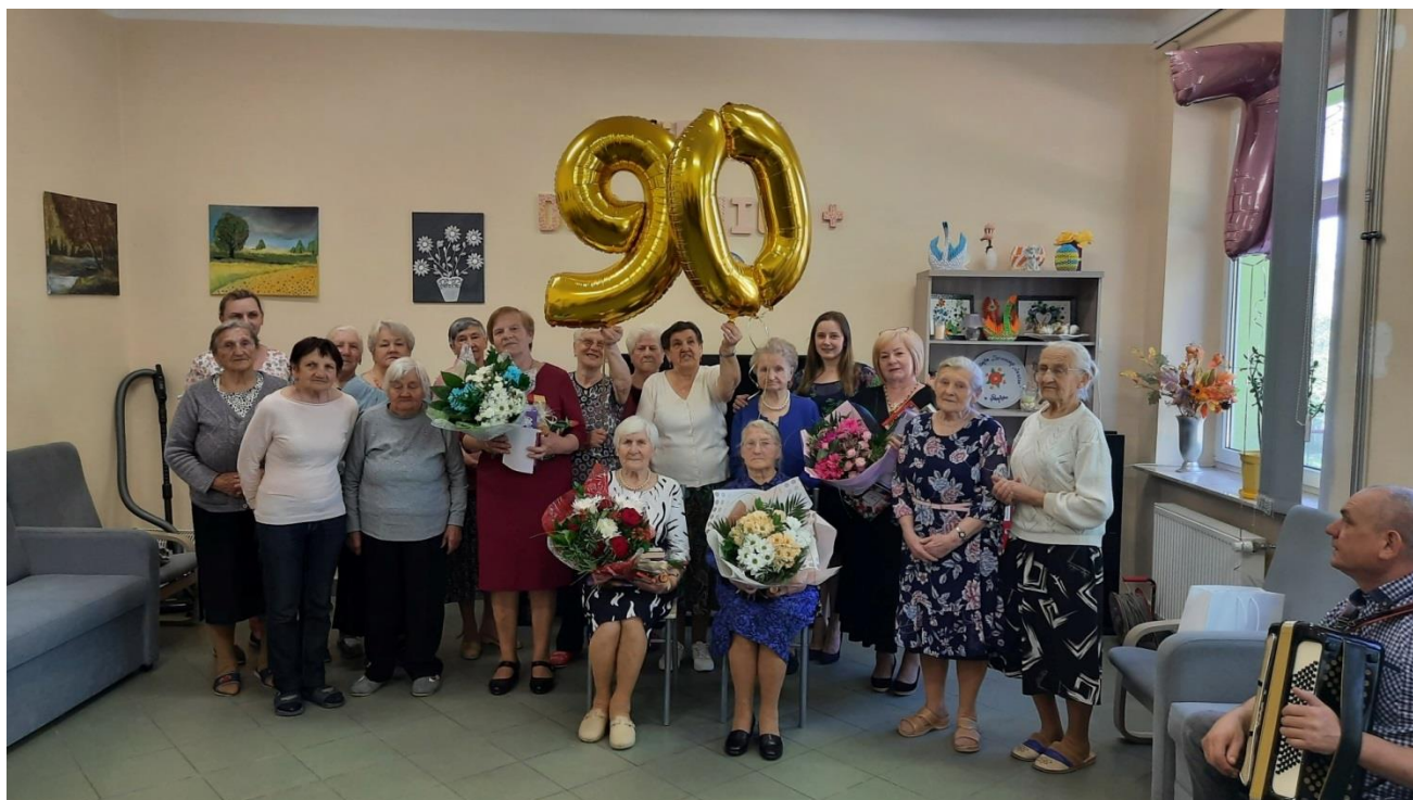
urodziny i imieniny u „Seniorek”