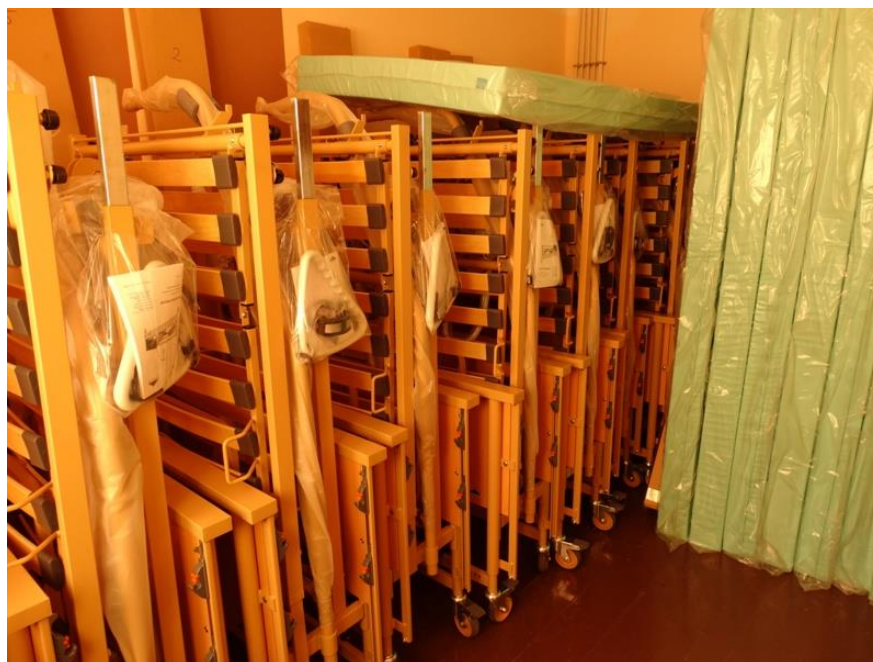
Sprzęt w wypożyczalni