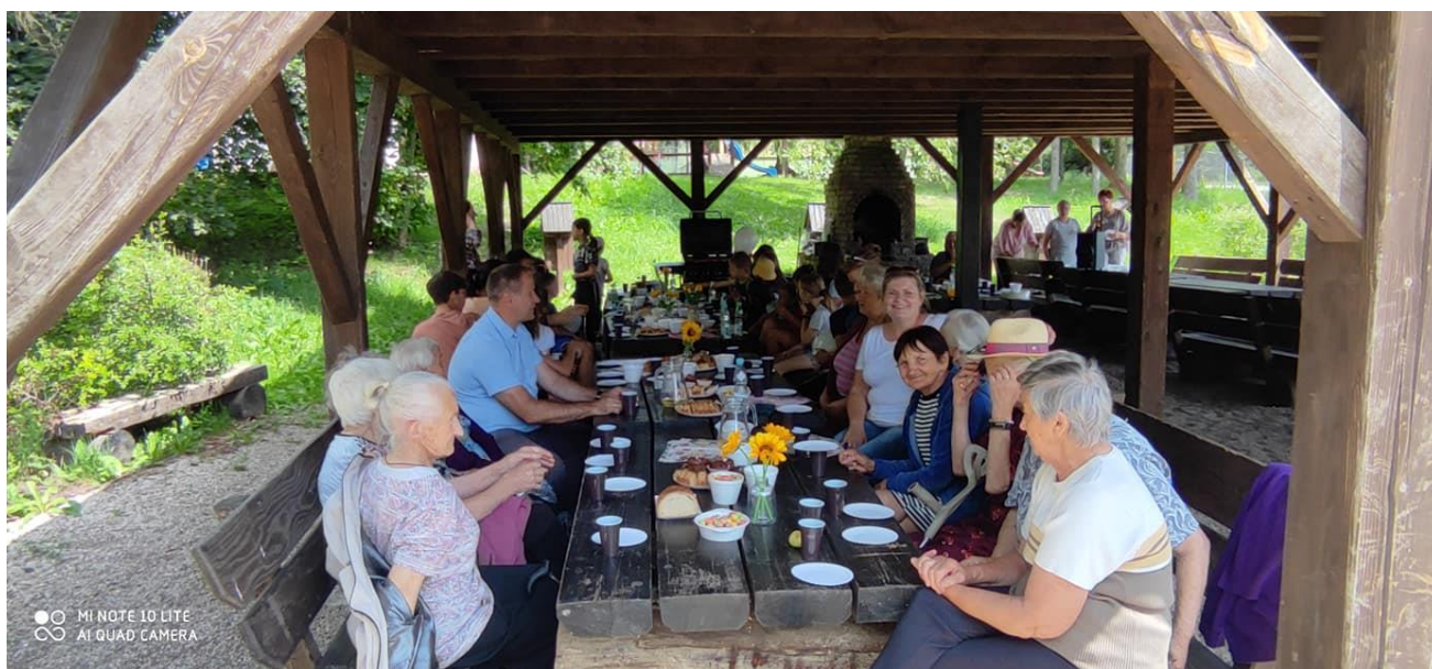
spotkanie integracyjne z dziećmi z Placówki Wsparcia