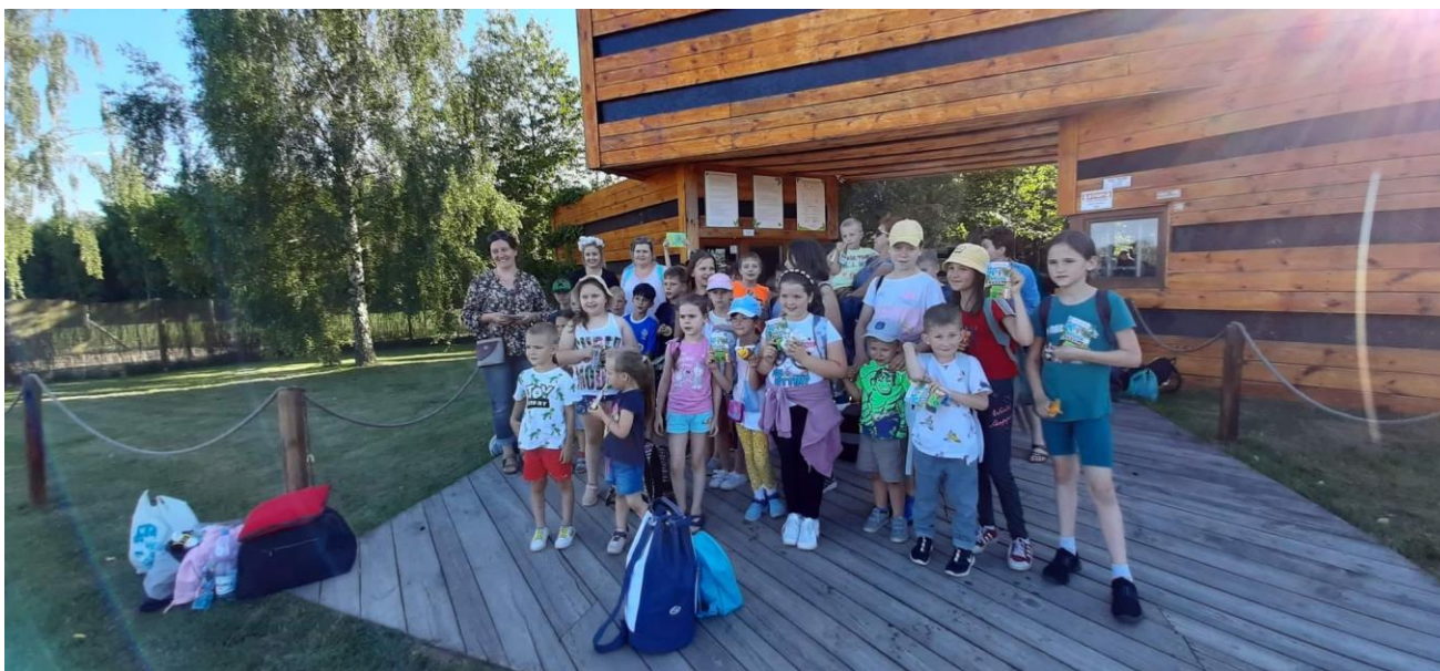
Zdjęcia własne – wycieczka do Sadów Klemensa