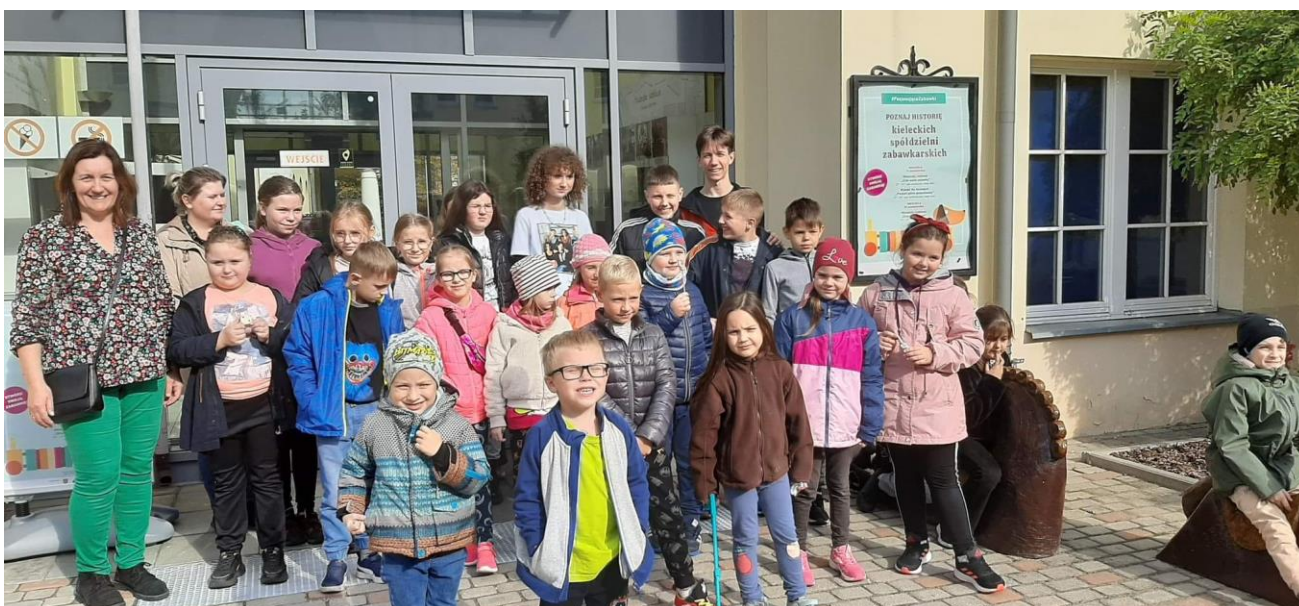
wycieczka do muzeum

Udział w zajęciach jest bezpłatny. Uczestnicy rozwijają wyobraźnię oraz zmysły. Uczestnicy, którzy aktywnie angażują się w małą społeczność placówki otrzymują paczki okolicznościowe np. na Dzień Dziecka czy Święto Bożego Narodzenia, co z pewnością powoduje radość z dawania i otrzymywania, zadowala ich pragnienia. W świetlicy dzieci otrzymują wsparcie w prawidłowy rozwój, nabywają umiejętności pokonywania codziennych trudności, niwelują deficyty w nauce oraz uczą się. Mają zapewniony posiłek w formie kanapek, przekąsek.