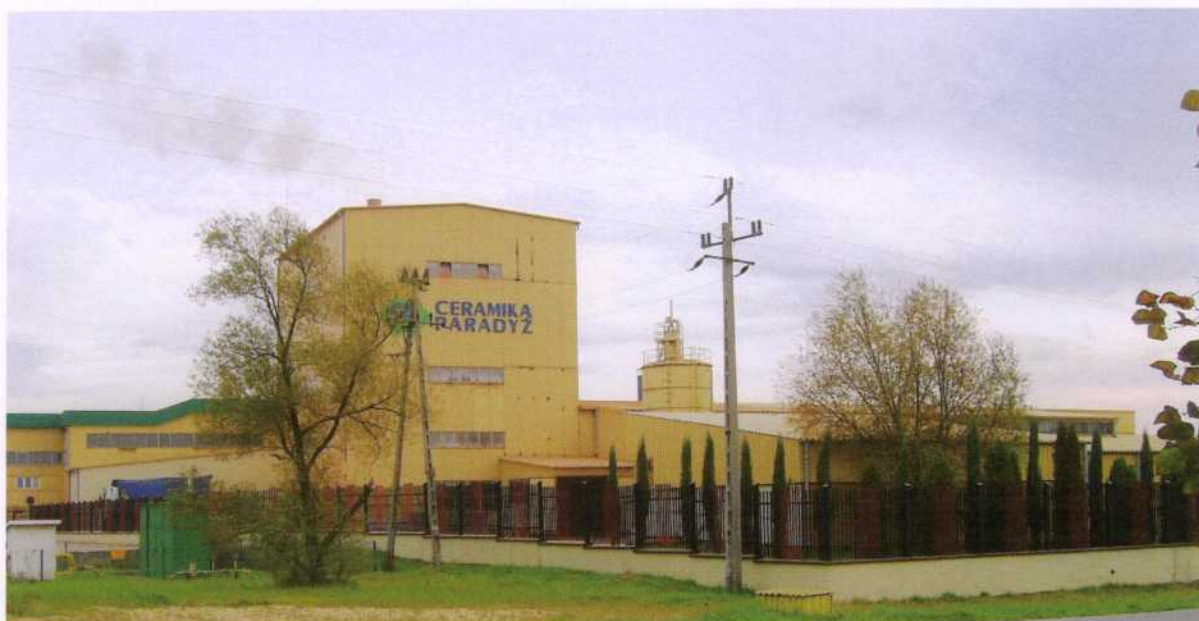
Zdjęcie 4. Zakład produkcyjny „CERAMIKA” Paradyż

firmy, zajmujące się handlem, usługami: budowlanymi, transportowymi, hydraulicznymi i remontowymi oraz wytwarzaniem wyrobów betonowych, gwoździ i palet. Firm tych jest niewiele, z uwagi na specyfikę Gminy Paradyż, która jest gminą małą i typowo rolniczą.