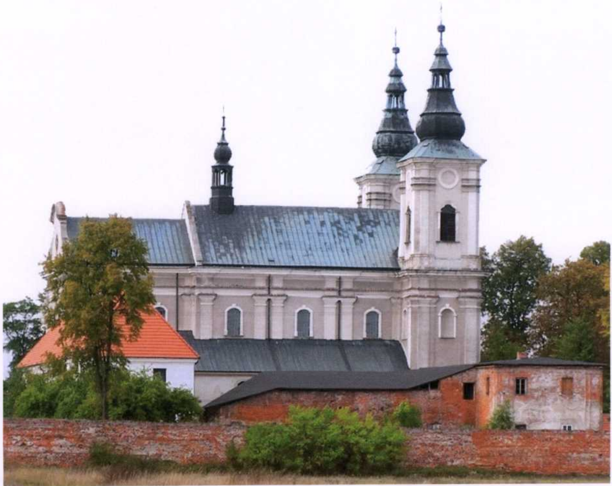
Zdjęcie 1. Kościół pod wezwaniem Przemienienia Pańskiego w Paradyżu

W skład tego obiektu wchodzi murowany kościół barokowy, wybudowany w latach 1747-1757, pod wezwaniem Przemienienia Pańskiego. Trzynawowy kościół, ma charakter okazałej bazyliki i znajduje się w nim wiele zabytków sztuki sakralnej. W świątyni znajduje się łaskami słynący Obraz Chrystusa Cierniem Koronowanego, przechowywany od ponad 300 lat z wielkim pietyzmem w głównym ołtarzu kościoła.