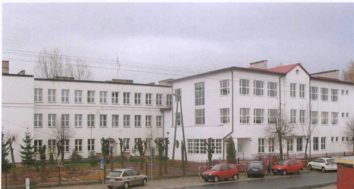
Zdjęcie 5. Budynek Zespołu Szkół Samorządowych w Paradyżu