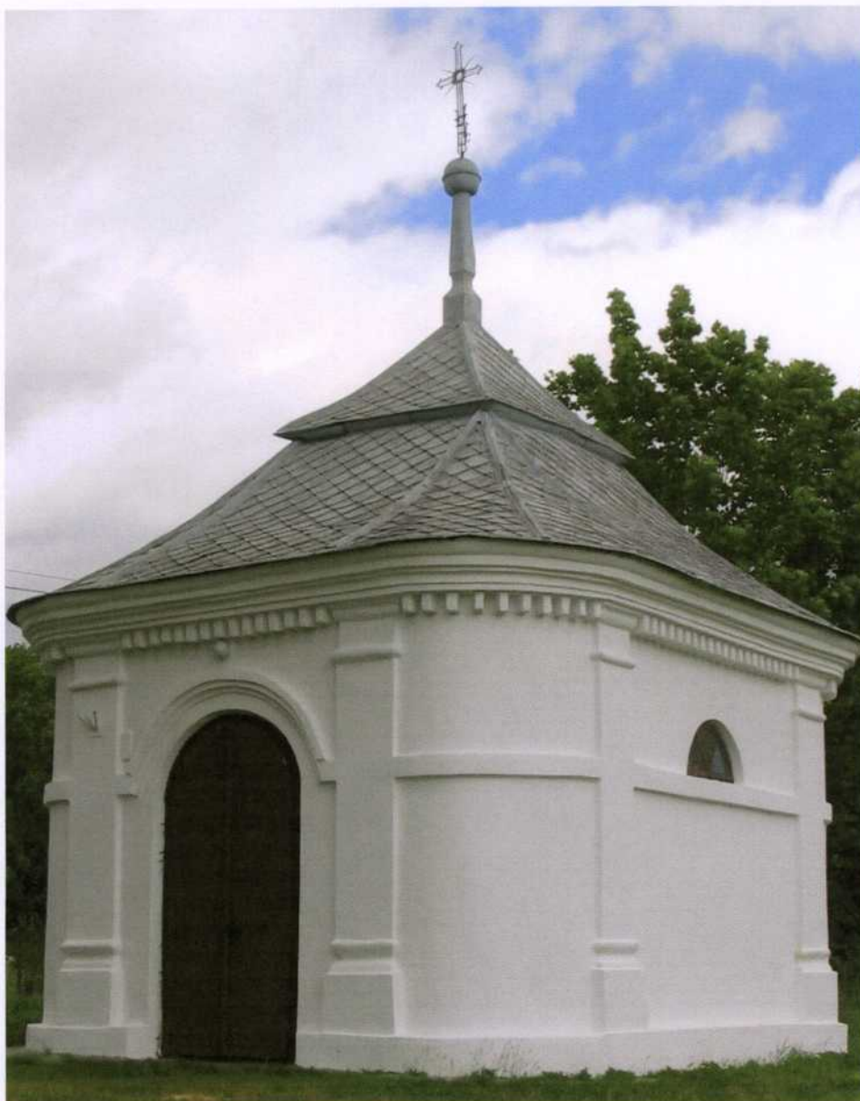
Zdjęcie 3. Kapliczka w Wielkiej Woli

Wart uwagi jest również kościół parafialny w Wójcinie.