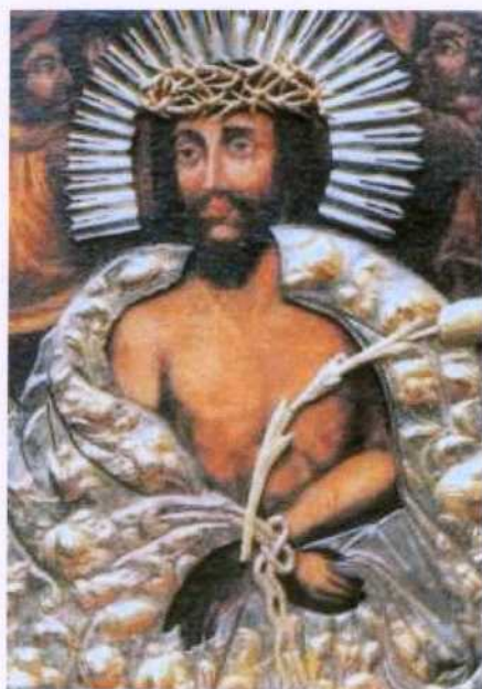
Zdjęcie 2. Cudowny obraz Chrystusa Cierniem Koronowanego