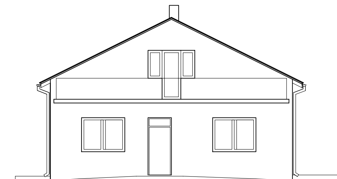
ELEWACJA FRONTOWA – PÓŁNOCNO – WSCHODNIA