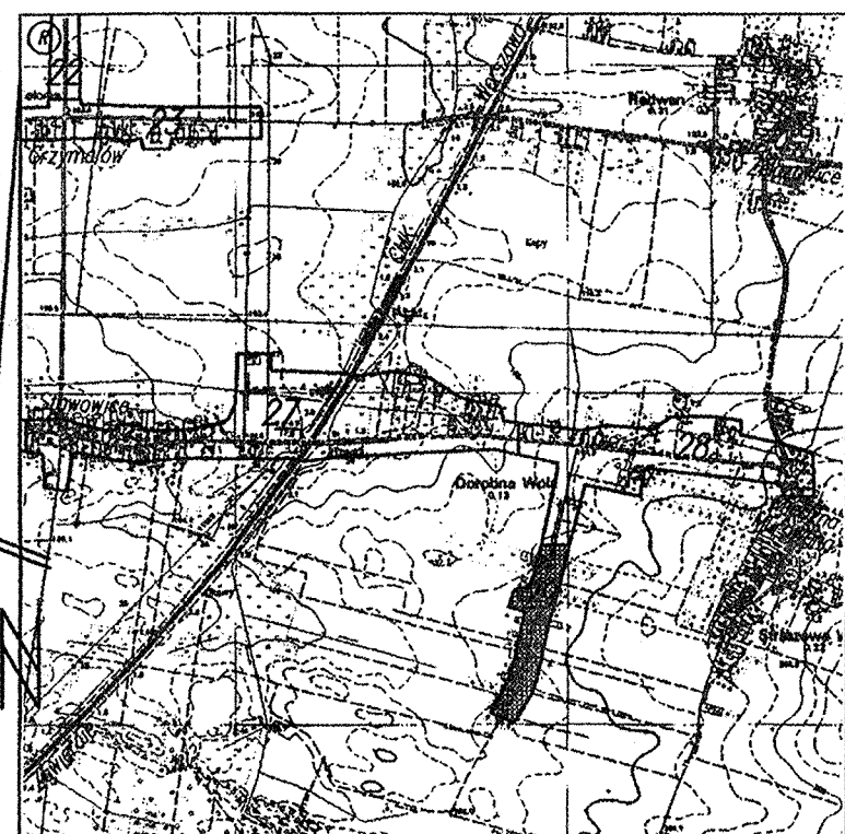
SKICZ ORIENTACYJNY SKALA 1:25 000

Granice działek wkartowano na podstawie ewidencji gruntów.